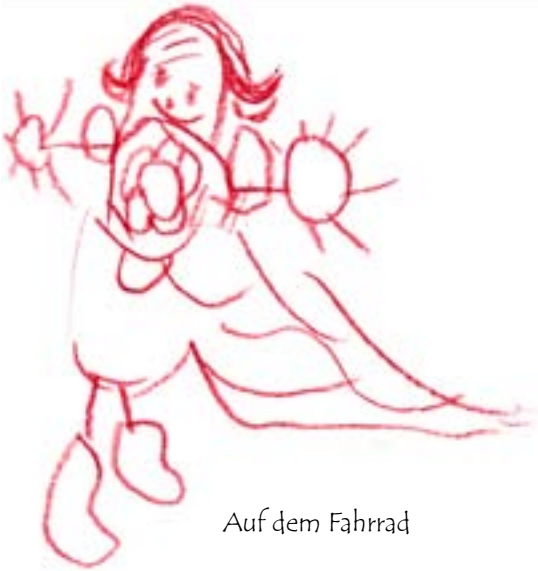
Auf dem Fahrrad

Müde von der Arbeit fahre ich nach Hause. Vor mir, auf dem Kindersitz, meine fünfjährige Tochter.